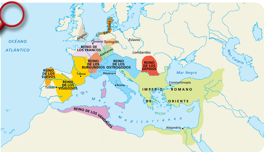
2. Los reinos germanos a finales del siglo v.