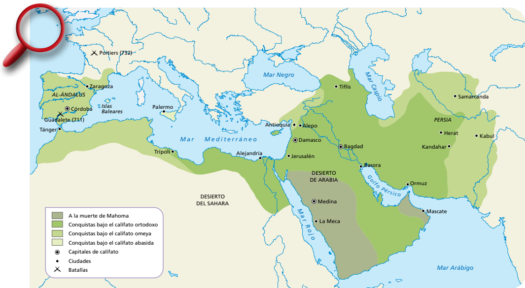
4. Expansión del islam durante la Edad Media.