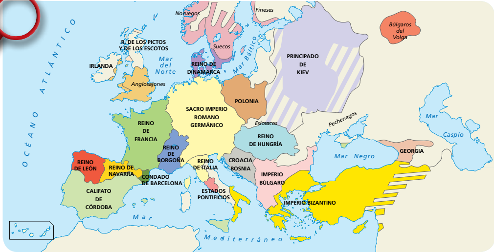
Principales reinos de Europa en torno al año 1000.